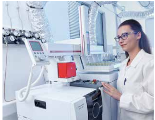
Gasförmiges Helium für die Gaschromatografie

Entsprechend den vielen verschiedenen Anwendungen gibt es auch sehr unterschiedliche Anforderungen an die Qualität und die Lieferform des gasförmigen Heliums. Die Reinheit des Heliums reicht dabei vom Ballongas bis zu „6.0“, also einer Reinheit von 99.9999 %, die Lieferform von der 1 Liter-Druckdose (CANGas) über 200 und 300 bar Druckgasflaschen und Bündel bis hin zum Trailer-Fahrzeug, das bei 200 bar ca. 1'800 m 3 gasförmiges Helium fasst.