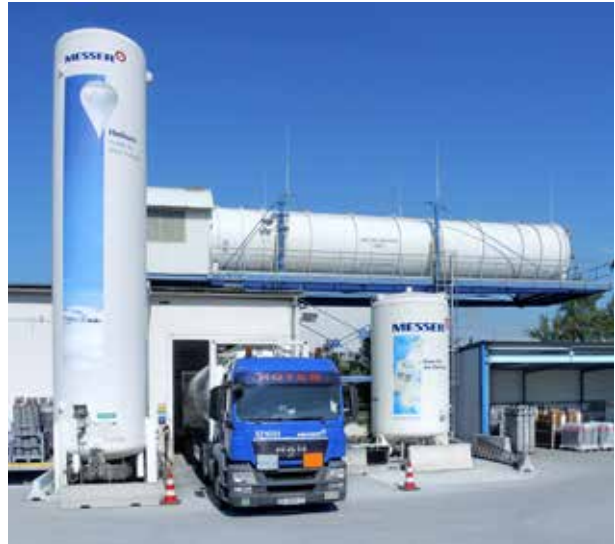
Liegender 120'000 Liter Speicherbehälter

Das beim Umfüllvorgang unvermeidbare Flashgas wird aufgefangen, gegebenenfalls durch Tieftemperaturadsorption gereinigt und mittels Kompressoren als gasförmiges Helium in Druckgasbehälter abgefüllt.