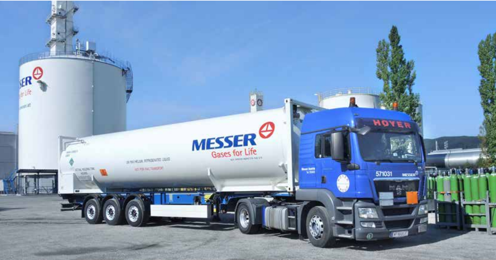
Tankcontainer für flüssiges Helium

In Europa befinden sich diese in Lenzburg (Schweiz), Mitry-Mory (Frankreich), Gumpoldskirchen (Österreich) und Pancevo (Serbien).