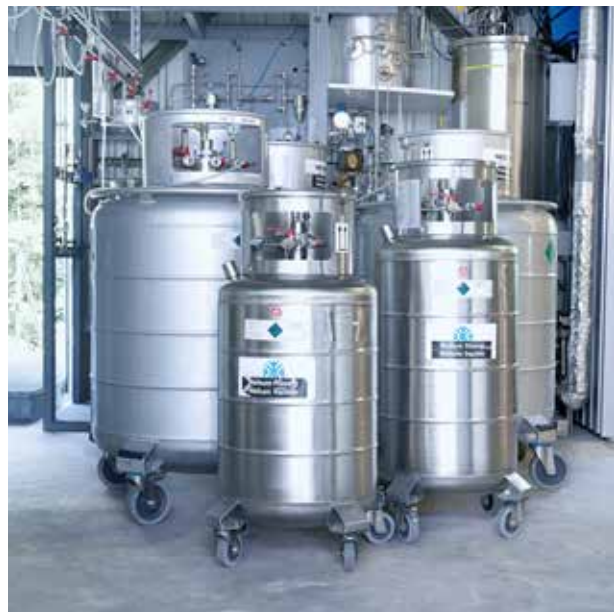
Dewars in verschiedenen Grössen

Bei Bedarf kann speziell ausgebildetes Servicepersonal von Messer beim Umfüllvorgang unterstützen.