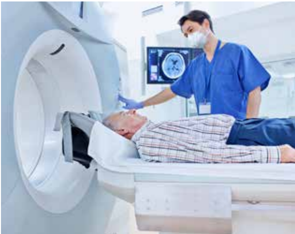
Flüssiges Helium kühlt Kernspintomografen

Neben der wohl bekanntesten Anwendung als Auftriebsgas für Ballons und Luftschiffe hat gasförmiges Helium noch eine ganze Reihe weiterer technischer Einsatzgebiete.