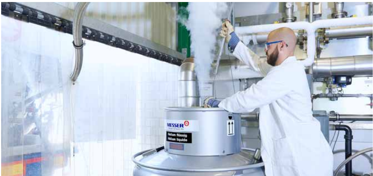
Umfüllung von flüssigem Helium im Lenzburg